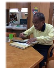
昔、伝票整理が得意だった利用者は、熱心にそろばんで計算中です。

デイサービスに来て頂くからには お一人お一人が楽しく帰宅後の生活にも結びついた生活リハビリがして頂けるようまずは皆さまのお話を伺って工夫していきます。