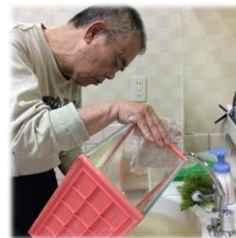
以前、金魚にエサをあげて下さっていた方は見守り水槽の水を変える事にチャレンジ中