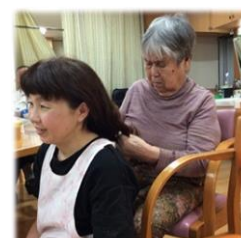
髪を結いたいとスタッフに声をかけて下さり、ただ今みつあみに夢中