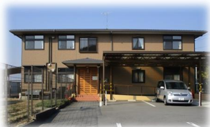
グループホームゆいまある