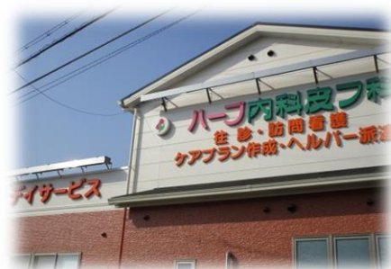
ハーブ在宅医療介護センター