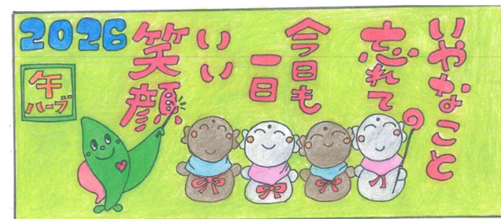
(快想デイ) 金井 セツ子様