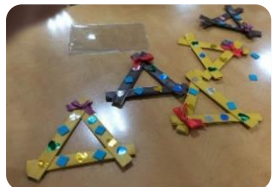
これもクリスマスの飾りです ハートやリボンでかわいく 飾り付けてくれました

さすような冷たい風も暖かい 春を迎えるための準備なんだ と思えば厳しい冬も乗り越え られる。