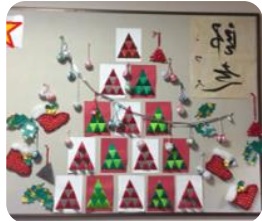
かわいいですね クリスマスカラーの赤と緑と 雪の白が素敵で暖かいですね

財布も身も心も寒くなるこの季節。 そんな中、運動療法デイサービスの 玄関はほっこり暖かい気分させて くれます💖