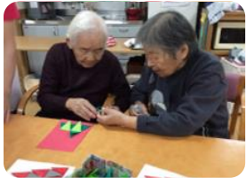
「こんな感じかしら」 「そうだね。ここにのりを つけるのね」