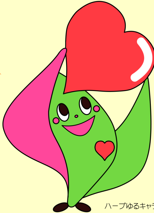
ハーブゆるキャラ ちむロン♪